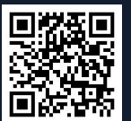
Koneksi Pertama Aplikasi